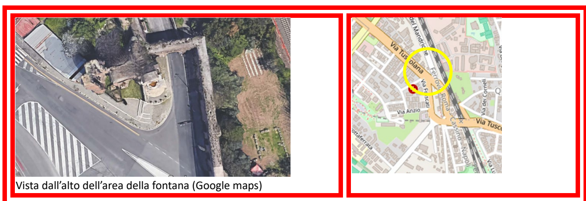
Vista dall'alto dell'area della fontana